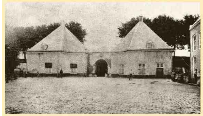
Twee foto's van de Antwerpsche poort (links de buitenzijde, rechts de binnenzijde). De poort en de vestingwerken werden met toestemming van Koning Willem III gesloopt.

Toen dit bericht in Breda aankwam werden 200 kozakken onder majoor Prins Gagarin naar Terheijde gestuurd om de schepen tegemoet te gaan. Later stuurde Van der Plaat nog een patrouille onder leiding van lt.kol Steinmetz, bestaande uit enkele kozakken en Bredasche burgers met gevorderde paarden. Deze vonden inderdaad de kozakken met de schepen: de kozakken hadden een Franse voorpost aangetroffen bij Terheijde, terwijl de schepen verderop lagen. Ze hadden de Franse voorpost verjaagd en daarna hun paarden voor de schepen gespannen. Tegen de avond kwamen zij terug met twee schepen, het ene met negen stukken geschut (12- en 24-ponders) en toebehoren, en het andere met 60.000 pond kruit en kogels. Als de patrouilles later waren geweest, was het geschut wellicht door een patrouille Franse lancers onderschept, die in de omgeving naar dezelfde schepen op zoek was.